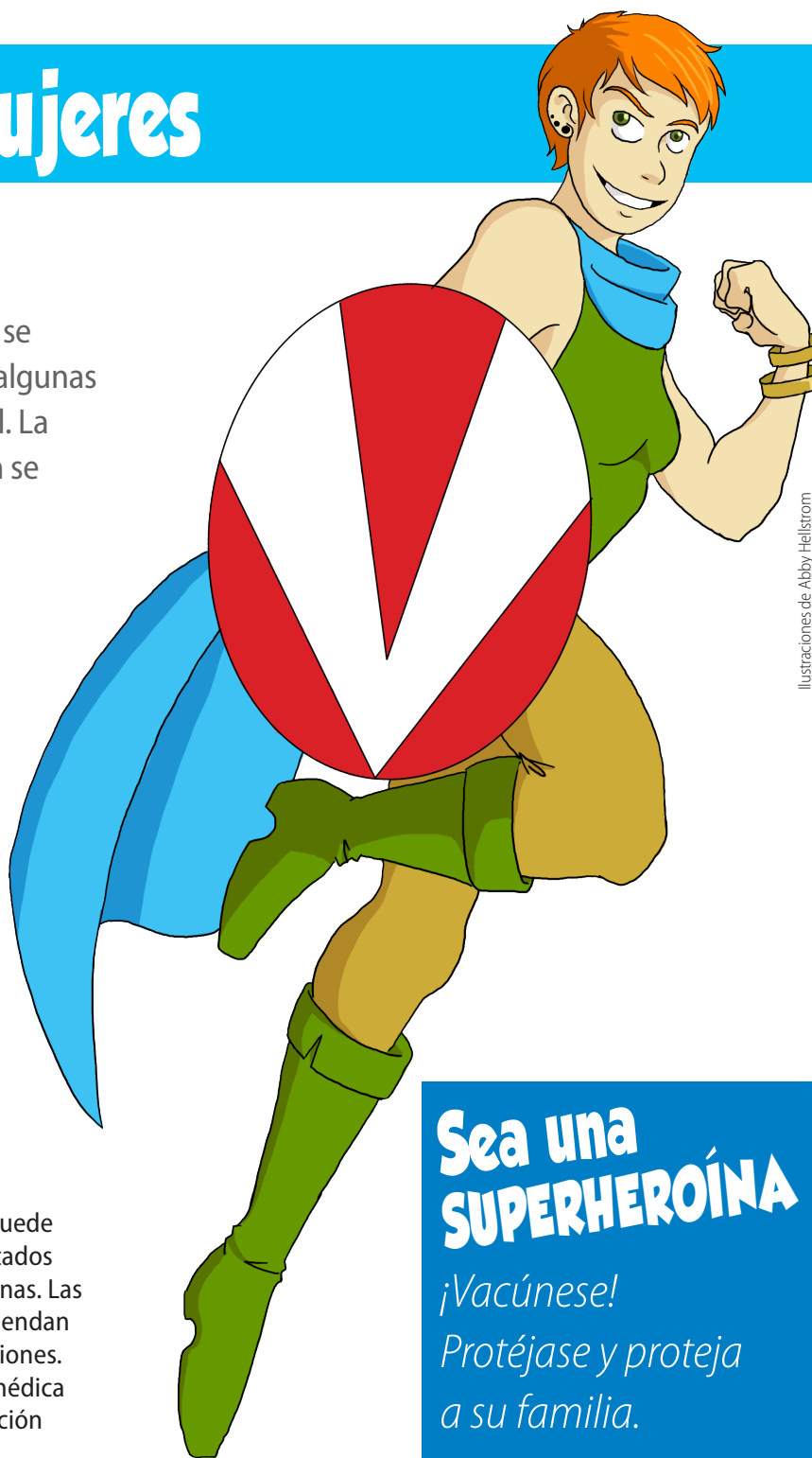
Ilustraciones de Abby Hellstrom